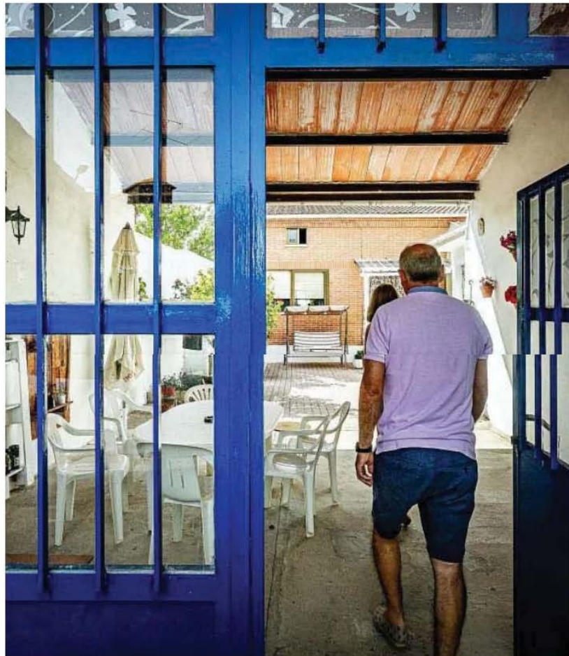
Una familia que vivía en Madrid y ha vuelto a un pueblo de la provincia de Valladolid.

Respecto al éxodo rural, el estudio revela cómo los jóvenes entre 18 y 39 años alegan como principal motivo para marcharse razones vinculadas a las oportunidades laborales (71,2 por ciento) y educativas (41,5). Sin embargo, son los jóvenes los menos satisfechos con su experiencia vital en la ciudad y hasta un 43 por ciento está insatisfecho con la experiencia y siete de cada diez valoran negativamente su paso por la urbe. Para Alonso, estos datos reflejan la importancia de poner en valor aspectos como la proximidad