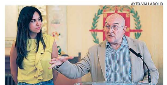
Jesús Julio Carnero junto a Blanca Jiménez

Una cita que tendrá lugar el 7 de septiembre a las 23 horas, de una de las cantantes con más éxito y que acumula un disco de oro, 54 discos de platino, uno de diamante y cuenta con más de seis millones de oyentes al mes en Spotify.