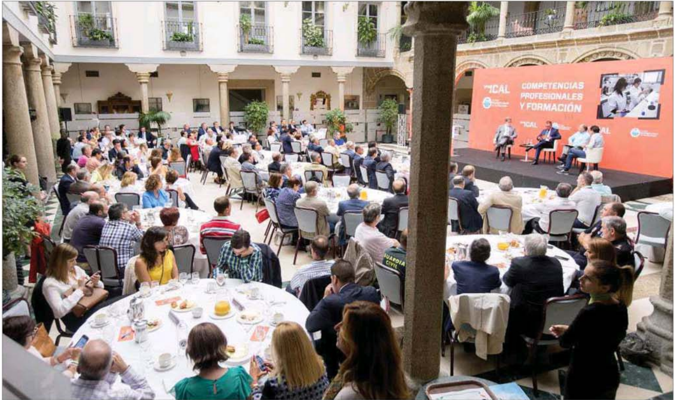
Asistentes a la jornada 'Competencias profesionales y formación', celebrada ayer en Ávila.