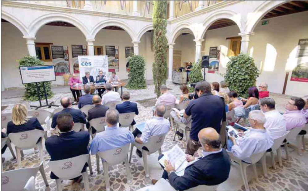
Asistentes a la reunión del Consejo Económico y Social de Castilla y León celebrado en Ávila.

ECONOMÍA | REUNIÓN DEL CONSEJO ECONÓMICO Y SOCIAL DE CASTILLA Y LEÓN EN ÁVILA