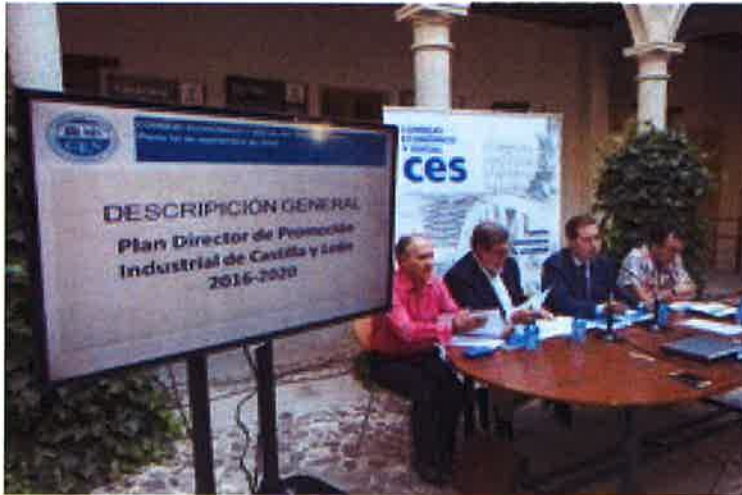
El CES celebra un