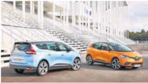
Los dos nuevos modelos de la firma automovilística.