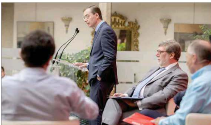
La intervención del presidente del CES cerró esta jornada.

«O apostamos por el conocimiento, o dejamos de crecer», aseguró el responsable del CES antes de advertir que sin inversiones en conocimiento e I+D+I el crecimiento económico experimentado por nuestro país desde 2014 debido al «viento de cola» de la bajada del petróleo y los tipos de interés se frenará o reducirá a partir de 2017. «Castilla y León debe