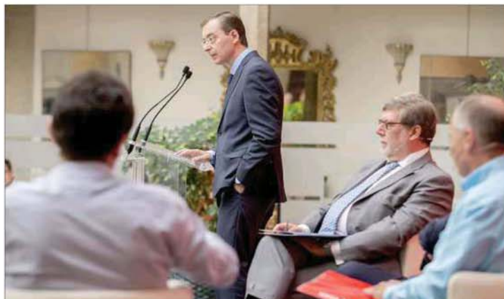
La intervención del presidente del CES cerró esta jornada.

«O apostamos por el conocimiento, o dejamos de crecer», aseguró el responsable del CES antes de advertir que sin inversiones en conocimiento e I+D+i el crecimiento económico experimentado por nuestro país desde 2014 debido al «viento de cola» de la bajada del petróleo y los tipos de interés se frenará o reducirá a partir de 2017. «Castilla y León debe cabalgar hacia la era del conocimiento», lo que requiere, apuntó Barrios, «inversiones en Formación Profesional, innovación y estimular el espíritu em-