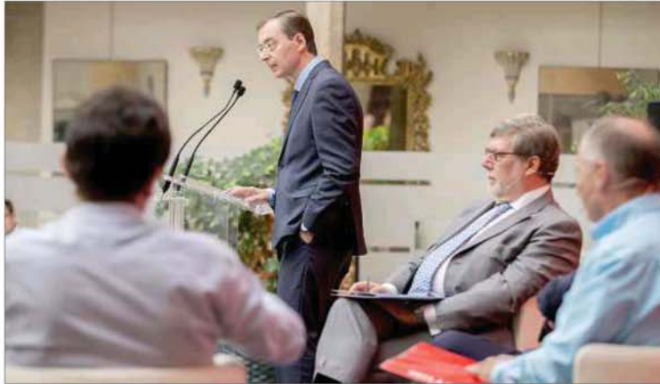
La intervención del presidente del CES cerró esta jornada. / DAVID CASTRO

«O apostamos por el conocimiento, o dejamos de crecer», aseguró el responsable del CES antes de advertir que sin inversiones en conocimiento e I+D+i el crecimiento económico experimentado por nuestro país desde 2014 debido al «viento de cola» de la bajada del petróleo y los tipos de interés se frenará o reducirá a partir de 2017. «Castilla y León debe cabalgar ha-