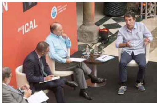
Acto central de la jornada organizada por el CES y la Agencia ICAL.

no de alumnos en los segundos cursos, por lo que hay que hacer cambios atendiendo a la realidad del momento» y también incidir en «la formación del profesorado». Aparicio declaró que «hay que cambiar la idea de que la FP es la cenicienta porque las principales demandas de las empresas es contar con cuadros medios formados, que son los que salen de esas aulas». Hernández, por su parte, se refirió más a la necesidad de «la formación permanente de los trabajadores, sobre todo de las pymes, para que se vayan reciclando».