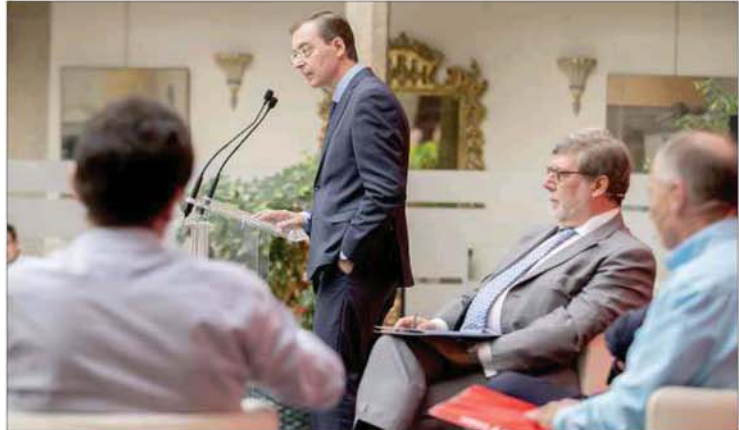
La intervención del presidente del CES cerró esta jornada.

«O apostamos por el conocimiento, o dejamos de crecer», aseguró el responsable del CES antes de advertir que sin inversiones en conocimiento e I+D+i el crecimiento económico experimentado por nuestro país desde 2014 debido al «viento de cola» de la bajada del petróleo y los tipos de interés se frenará o reducirá a partir de 2017. «Castilla y León debe balagar hacia la era del conocimiento», lo que requiere, apuntó Barrios, «inversiones en Formación Profesional, innovación y estimular el espíritu em-