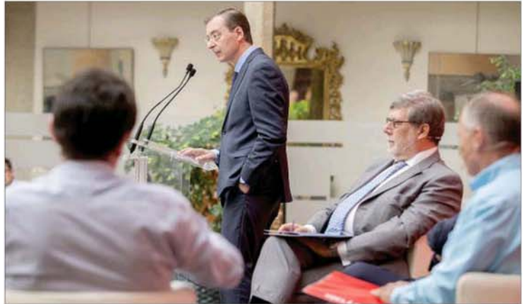
La intervención del presidente del CES cerró esta jornada.

«O apostamos por el conocimiento, o dejamos de crecer», aseguró el responsable del CES antes de advertir que sin inversiones en conocimiento e I+D+I el crecimiento económico experimentado por nuestro país desde 2014 debido al «viento de cola» de la bajada del petróleo y los tipos de interés se frenará o reducirá a partir de 2017. «Castilla y León debe