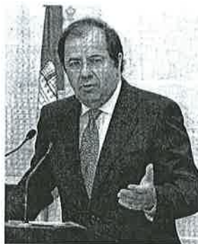
J. V. Herrera, presidente de Castilla y León.

Fuente: CES, Asuntos Sociales y Seguridad Social