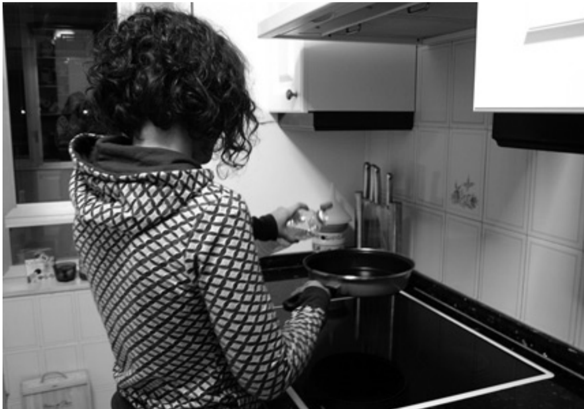
Al término de 2010 había más de 53.000 mujeres que se dedicaban a las tareas del hogar. LAURA ALONSO ORIA

En ese documento, se constata la "naturalización de la inserción laboral de las mujeres" ya que en la actualidad "no existe en la sociedad cuestionamiento alguno a la realización de actividades productivas por las mujeres". En cuanto a las razones aducidas para trabajar, más del 40% ciento de las mujeres lo hace por necesidad económica y más del 20% por independencia económica, mientras que entre el 5 y el 10% alegan razones como ejercer su profesión, realización personal y gusto por el trabajo en sí.