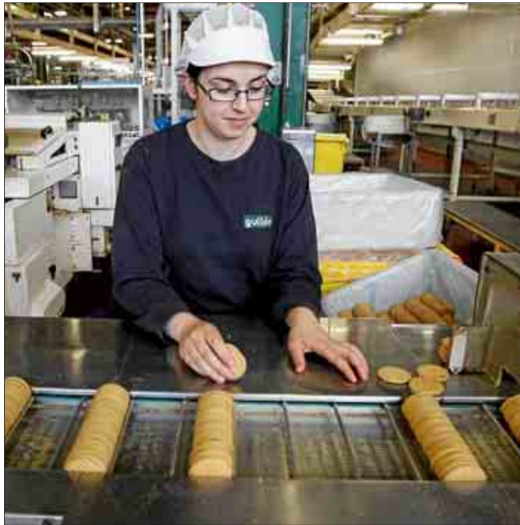
Una mujer trabajando en una empresa galletera.

Constatadas las enormes diferencias que persisten en el mercado