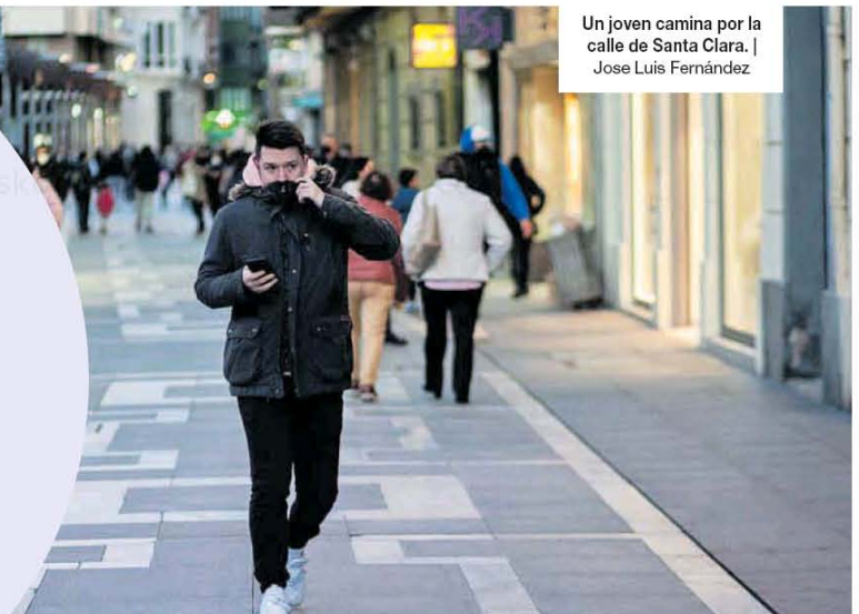
Un joven camina por la calle de Santa Clara. | Jose Luis Fernández

Por su parte, en la población entre 30 y 34 años la tasa de emancipación residencial continuó descendiendo. A finales de 2021, el 67,3% de la población de esta franja de edad vivía por su cuenta.