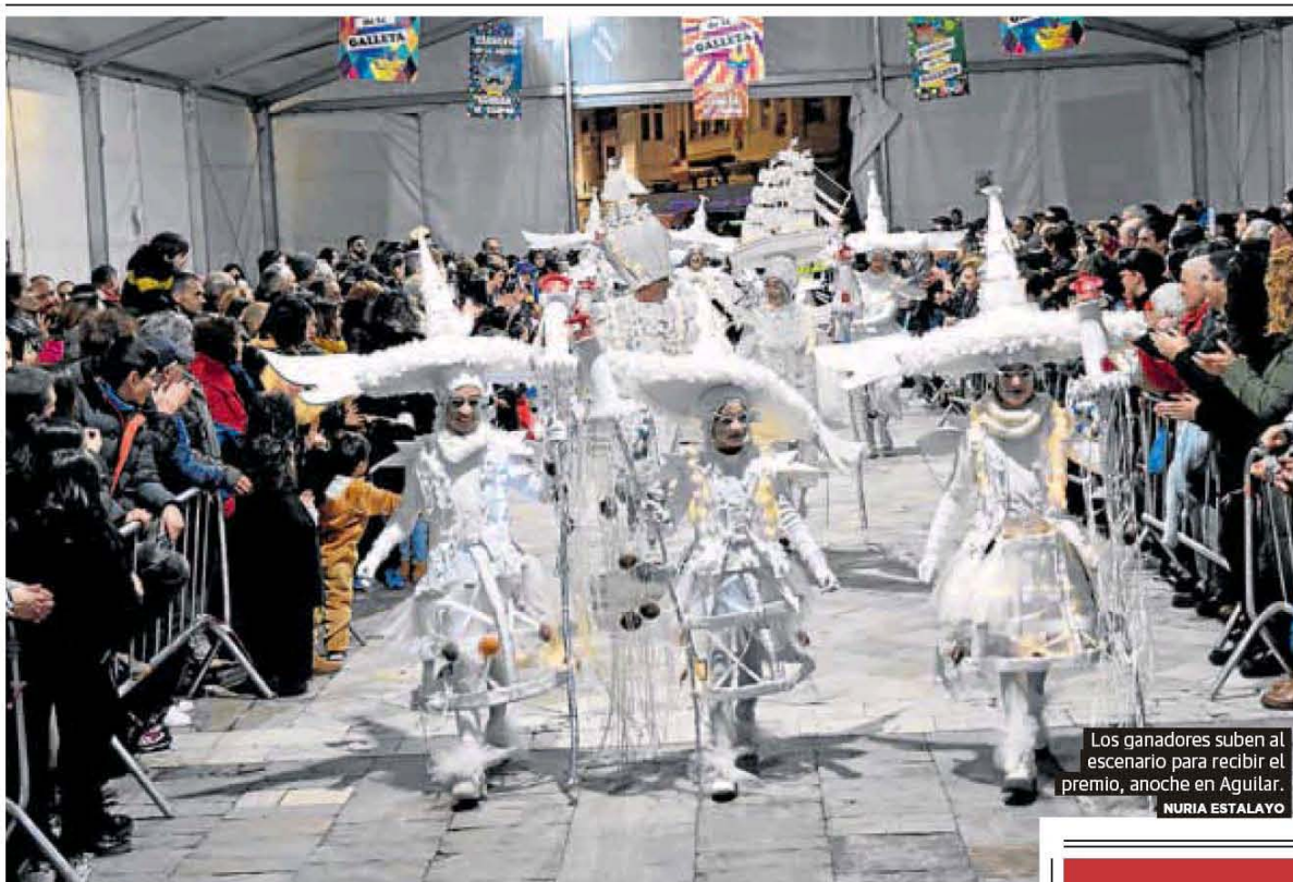
Los ganadores suben al escenario para recibir el premio, anoche en Aguilar.

del Observatorio de la Emancipación referidos al segundo semestre de 2021, que establecen en 29,8 años la edad media en la que se abandona el hogar familiar en la región. La precariedad laboral y el encarecimiento de los alquileres y de los suministros están detrás de esta tardanza. P16