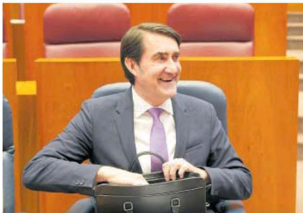
El consejero Juan Carlos Suárez-Quiñones en el pleno.