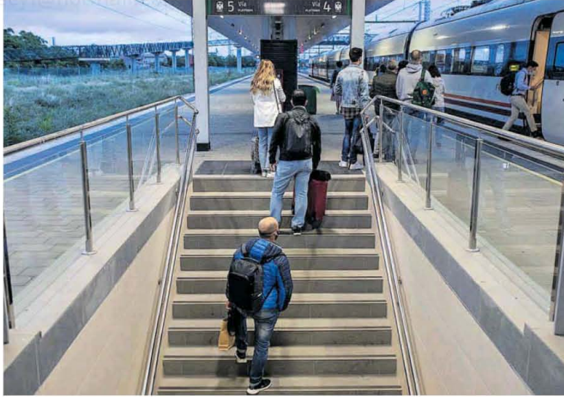
Viajeros en la estación de tren de Zamora.

El informe del Observatorio de Emancipación elaborado por el Consejo de la Juventud de España demuestra cómo Zamora es uno de los territorios con más probabilidades de que una persona joven nacida en su seno esté ahora mismo residiendo en otra provincia. Concretamente, el 11% de su talento joven vive fuera; la mayoría de ellos, en Madrid. En el rango de 16 a 29 años, hay un 4% de zamoranos que ya hacen su vida en la capital de España. Un dato que se amplía sobremanera al analizar el grupo etario inmediatamente superior, el de los 30 a 34 años. En ese caso, el 10,2% de los ciudada-