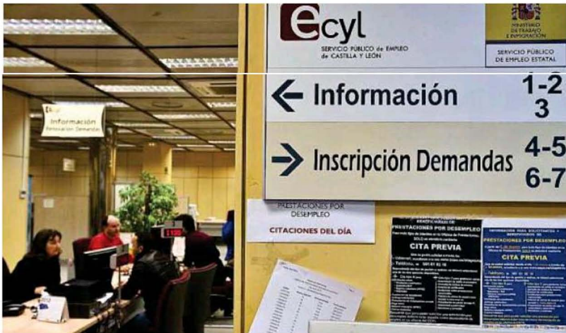
Imagen del interior de una oficina de empleo de Castilla y León.

Unos 5.100 trabajadores de Castilla y León se marcharon de la región a otras comunidades en el último año, y otros 15.000 se movieron entre las 9 provincias