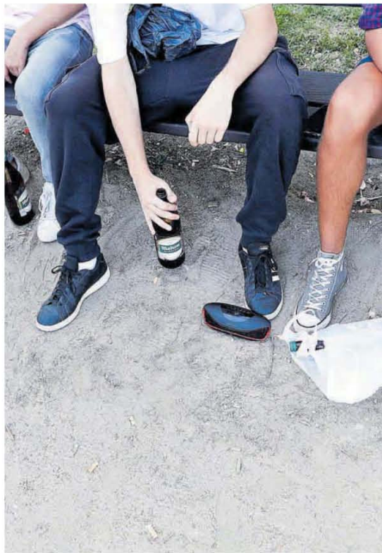
Un grupo de jóvenes toma bebidas alcohólicas en un botellón.

En el ámbito sanitario, el programa «Ícaro Alcohol», a través de los profesionales de Urgencias, ha realizado intervenciones con 112 menores que fueron atendidos por problemas derivados del consumo de bebidas alcohólicas (intoxicación, accidentes, lesiones, traumatismos, agresiones...).