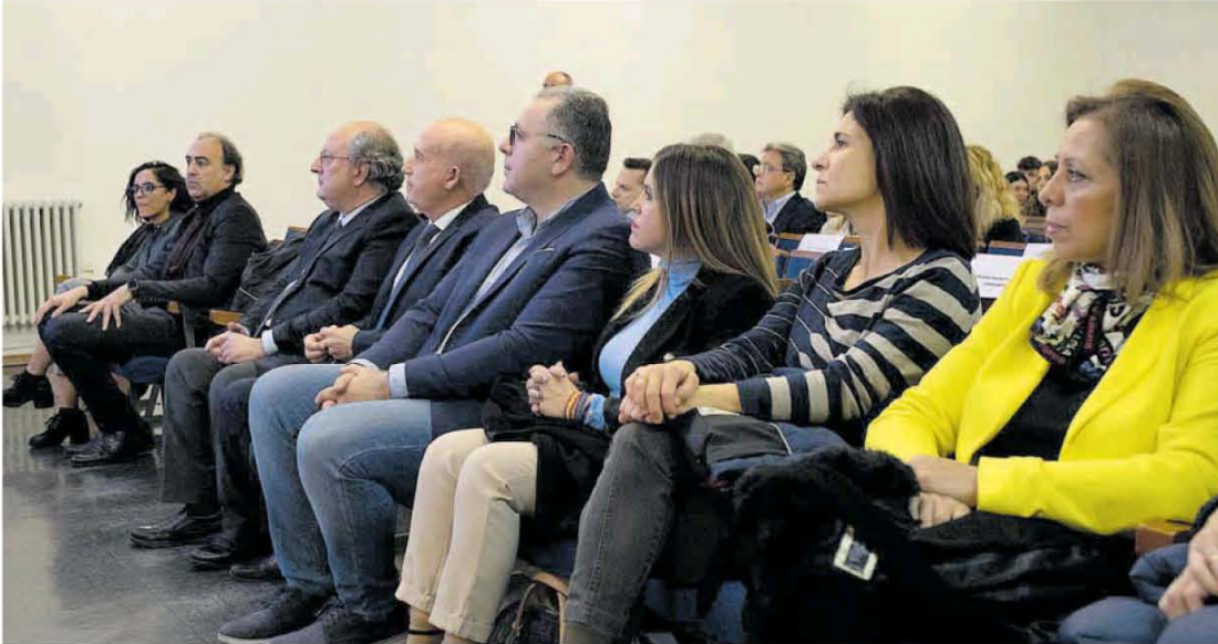
Las autoridades, durante el acto celebrado en el Colegio Universitario.