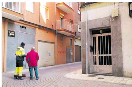
Bloque de viviendas donde apareció el cadáver de la mujer.

La Policía ha tomado ya declaración a varias personas en calidad de testigos y se está a la espera de los informes policial y forense, que se pondrán