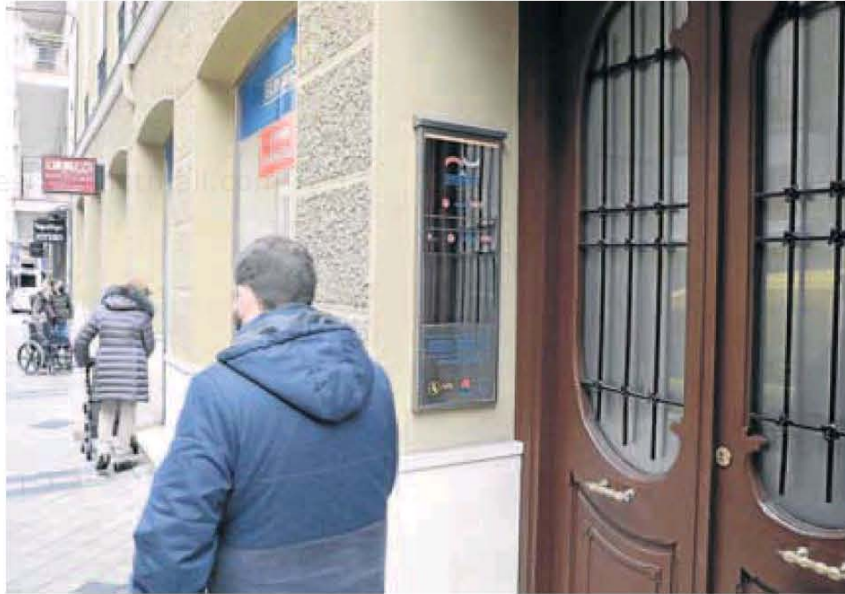
Sede del SERLA en la calle Molino de Valladolid. CARLOS ESPESO

Según CC OO y UGT, que emitieron un comunicado conjunto, el informe concluye que la falta de financiación y la extinción de la Fundación Serla supondría que