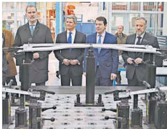
El rey Felipe VI durante su visita a la empresa Gestamp.

Durante la visita, el rey se ha interesado por la tecnología de estampación en caliente, que es una de las es-