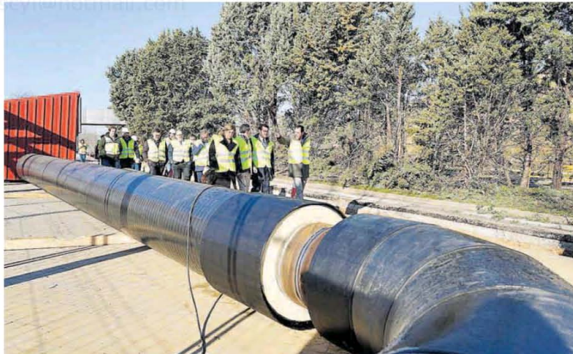
El alcalde de Valladolid, a la derecha, junto al consejero Suárez-Quiñones, durante su visita ayer a las obras de instalación en la ciudad de la instalación de energía térmica.

Actualmente, Somacyl realiza el abastecimiento de energía térmica renovable a 124 centros consumidores de todo tipo en Castilla y León, con una potencia instalada de 64.700 kilovatios; 101,5 millones de kilovatios hora anuales de energía suministrada; 38.500 toneladas consumidas de astilla forestal y 1.250 toneladas de pellets, y 37.500 toneladas de CO 2 emitido al año.