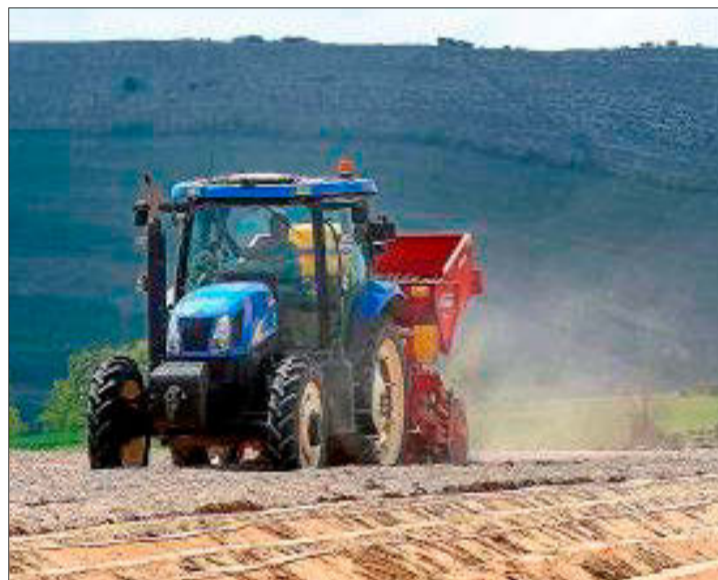
Un agricultor siembra patatas en la localidad palentina de Pomar de Valdivia.

► MEDIDAS TRIBUTARIAS. En el contexto de la guerra de Ucrania, el CES urge a adoptar, en el corto plazo, medidas tributarias, de Seguridad Social y de empleo para paliar la espiral inflacionista. Recomienda, a medio y largo plazo, con carácter estratégico, reducir la dependencia de la industria agroalimentaria de Castilla y León respecto de sus proveedores externos de materias primas y energía, diversificando y/o asegurando las fuentes de suministro de los inputs productivos esenciales. Ha de aplicarse al modelo una visión estratégica que asegure y contemple el incremento a largo plazo de la capacidad productiva del sector agrario, a fin de garantizar el