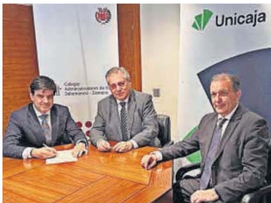
Momento de la firma del convenio entre Unicaja y el Colegio de Administradores de Fincas de Castilla y León.

en la región, y con las comunidades de propietarios clientes de la entidad. Este acuerdo conlleva una oferta especial a las comunidades para financiar la realización de reformas o la rehabilitación que suponga mejoras en materia de eficiencia energética y sostenibilidad. Además, se aplicarán unas condiciones preferentes en materia de comisiones a las cuentas de las comunidades que tengan un administrador de fincas colegiado.