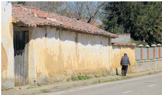
León sigue sufriendo el envejecimiento y la despoblación.

bos parámetros más de tres cuartas partes del total de localidades de la comunidad, en concreto un 76,25%, cuando la población que vive en estos municipios solo suma, en total, 341.996 habitantes, el 14,2%.