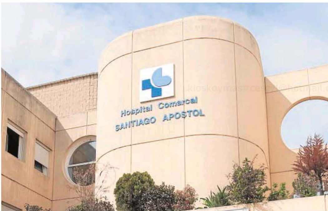
El Hospital Santiago Apóstol de Miranda de Ebro es uno de los dos públicos que practica abortos en la región

Sí, los viejos de pueblo también tienen techo de cristal. No es que sean una minoría pero, como tantas otras, necesitan de reconocimiento, políticas de igualdad, que les dediquemos un día o que las ministras también dejen de hacerse fotos en público si no hay uno de ellos en la presentación. El problema no es que falten carreteras y hospitales, es que nos dan asco esos señores que, por cierto, tienen más riesgo de desaparecer que los lo-bos , lo dice un informe del CES.