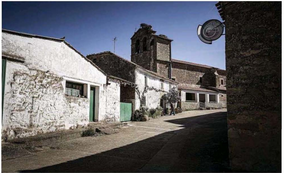
Imagen de la calle de un pueblo de la provincia de Soria.

En relación a la división interna de los municipios de Castilla y Le-