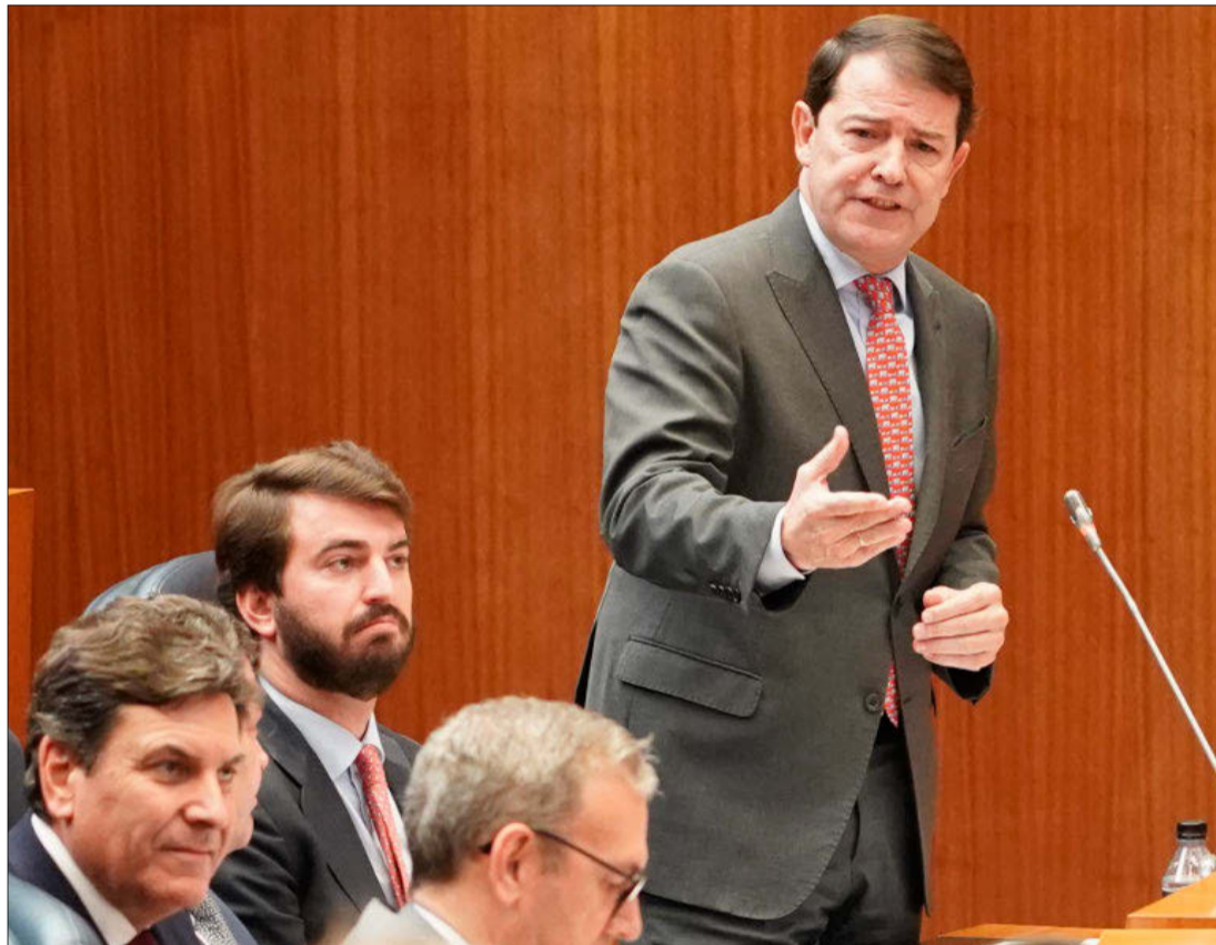
El presidente de la Junta, Alfonso Fernández Mañueco, durante su intervención en el pleno de las Cortes.

Más allá de las menciones que realizó Fernández Mañueco en su cara a cara con Tudanca, todos los miembros del Ejecutivo autonómico que fueron preguntados por la oposición aprovecharon sus intervenciones para cargar duramente contra el Gobierno central por las cesiones a las formaciones independentistas. Además, en la mayoría de los casos reservaron sus alusiones para el turno de réplica, dejando a sus respectivos interlocutores sin la