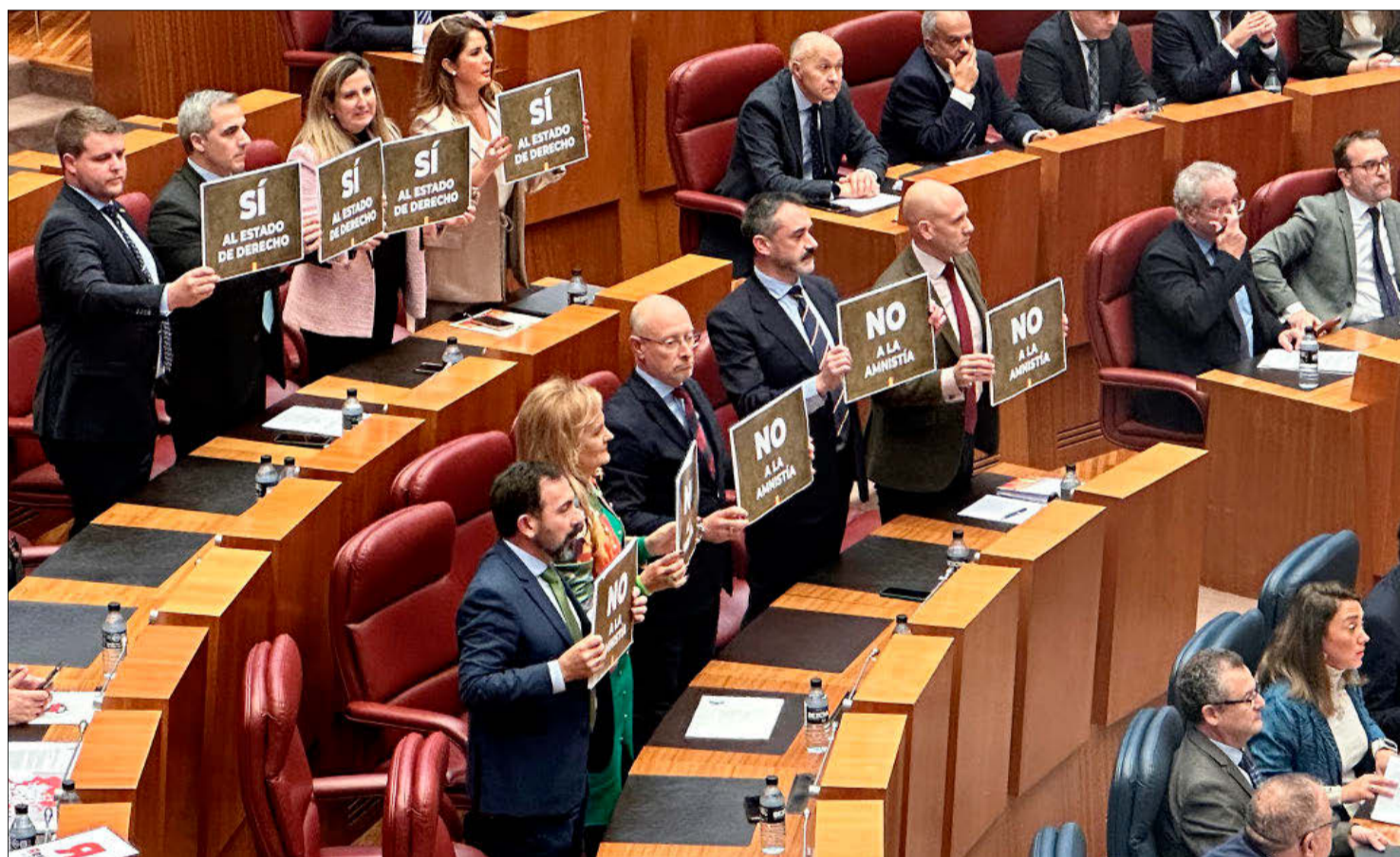
ICAL- VOX SACA LA PANCARTA DEL «NO A LA AMNISTÍA». Que el Pleno de las Cortes de Castilla y León iba a estar marcado por la amnistía y la condonación de la deuda a Cataluña, pactada por Pedro Sánchez con los independentistas para garantizar su investidura, se vela nada más comenzar la sesión cuando los procuradores de VOX se levantaba pancarta con el «no a la amnistía» en mano. La reacción de Pollán, parar el pleno y ordenar su inmediata retirada.