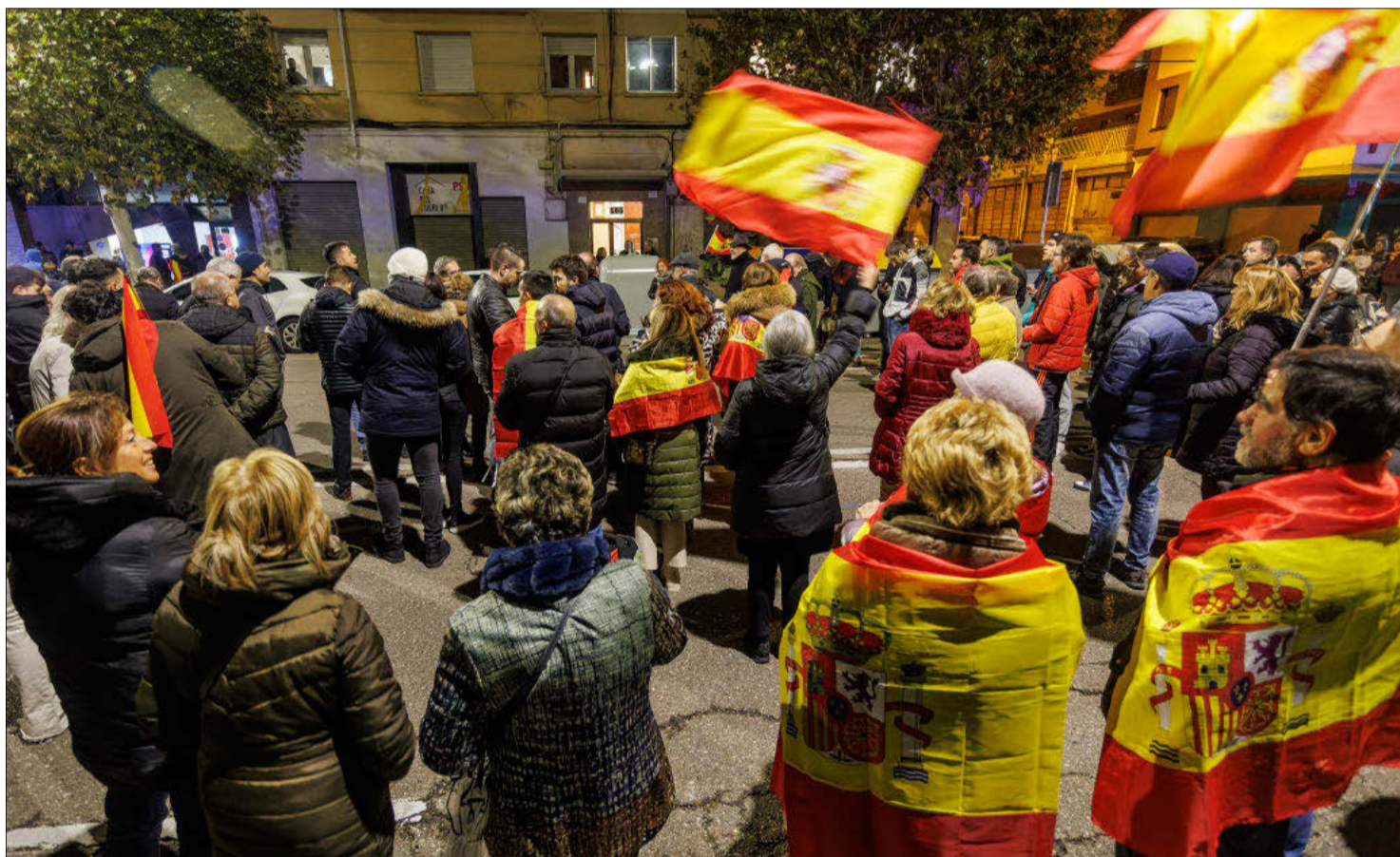
CORTAN LA CALLE VITORIA FRENTE A LA SEDE DEL PSOE PARA PROTESTAR POR LA AMNISTÍA. Banderas de España y consignas contra el PSOE y su líder, Pedro Sánchez, en la protesta que ayer tarde se produjo frente a la Casa del Pueblo en la calle Vitoria de Burgos. Gritos de «Sánchez, dimisión» y cánticos con el ya famoso «Qué te vote Txapote» resonaron ante la sede socialista, donde se congregaron más de doscientas personas Pág. 4