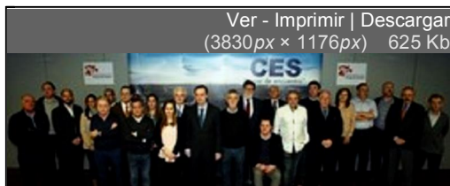
El presidente del CES, Germán Barrios, posa junto a los integrantes del Grupo de Enlace del Consejo Económico y Social de Castilla y León

El Consejo Económico y Social (CES) de Castilla y León constituyó hoy el denominado Grupo de Enlace con el tercer sector, es decir, con la parte de la sociedad civil organizada no representada actualmente en la institución, a la que ya pertenecen los sindicatos, empresarios, consumidores y organizaciones profesionales agrarias, entre otros. "Se abre un nuevo horizonte en las políticas del CES conforme a lo que la Constitución Española y el Estatuto Autonómico llaman democracia participativa", resumió el presidente del organismo, Germán Barrios.