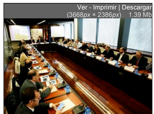
Constitución del Grupo de Enlace del CES de Castilla y León