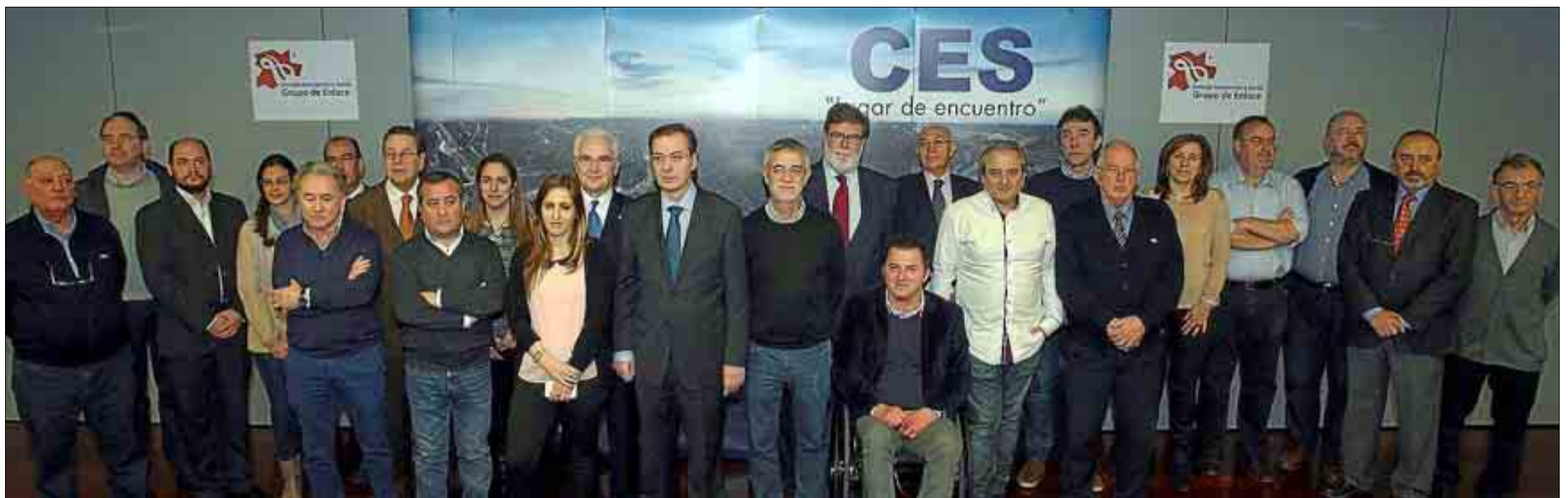
Foto de familia de los directivos del CES con los representantes de las organizaciones sociales que estarán representadas en el Grupo de Enlace.