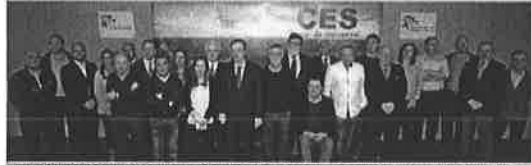
El presidente del CES, Germán Barrios, posa junto a los integrantes del Grupo de Enlace del Consejo Económico y Social de Castilla y León

organizaciones profesionales agrarias, entre otros. "Se abre un nuevo horizonte en las políticas del CES conforme a lo que la Constitución Española y el Estatuto Autonómico llaman democracia participativa", resumió el presidente del organismo, Germán Barrios.