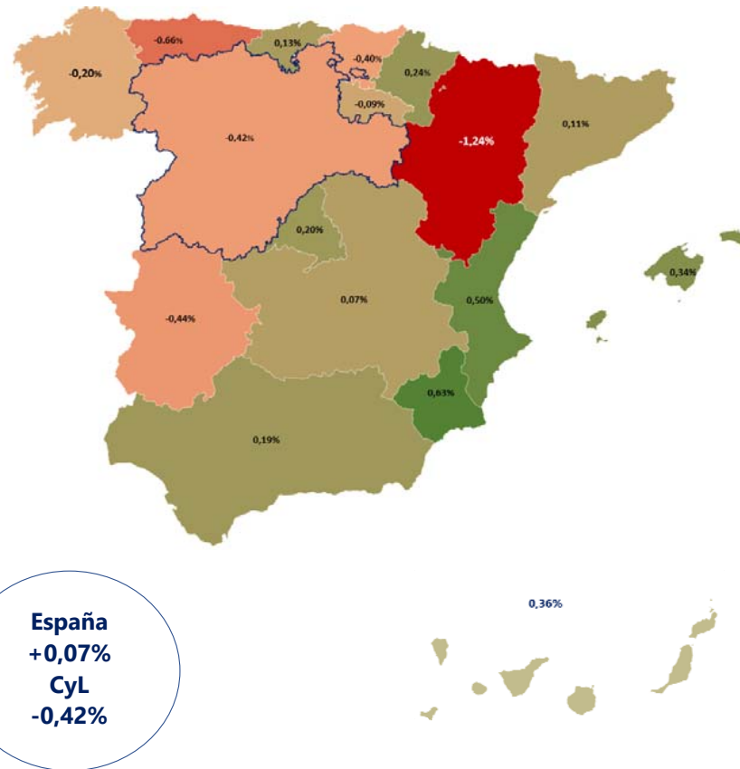
Variación interanual %