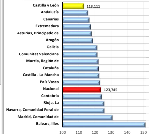
Índice Cifra de Negocios. Comparación con 2015. Base 100 = 2015

Todas las comunidades autónomas aumentan su cifra de negocios del Sector Servicios de Mercado en junio respecto al mismo mes de 2017. Cantabria (8,0%), Principado de Asturias (7,9%) y Aragón (7,5%) son las que más suben. Por su parte, Andalucía (3,0%), Comunidad Foral de Navarra (3,1%) y Comunitat Valenciana (3,2%) registran los menores incrementos. Castilla y León aumenta un 6,2%.